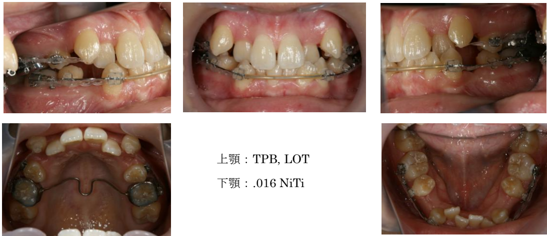
図5 上下顎レベリング開始